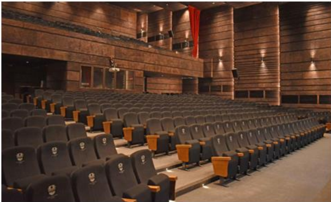
TEATRO CENTRO CULTURAL DE BUIÑ BUIÑ | CHILE