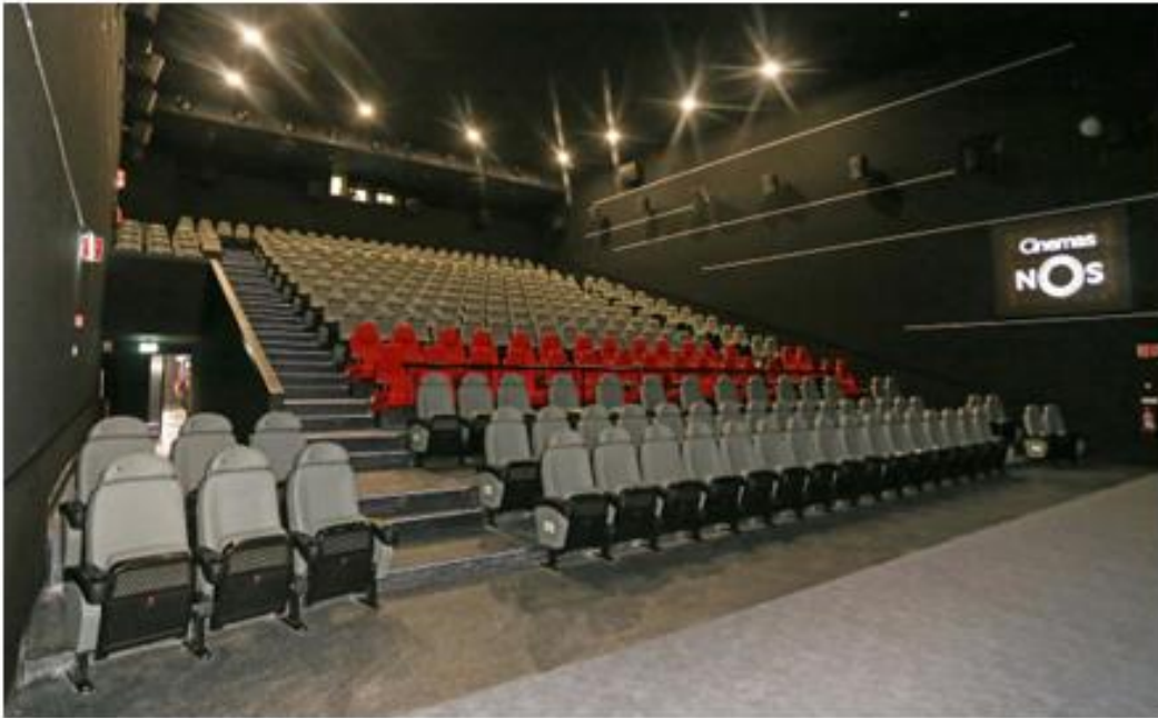
CINEMAS NOS OEIRAS PARQUE PAÇO DE ARCOS | PORTUGAL