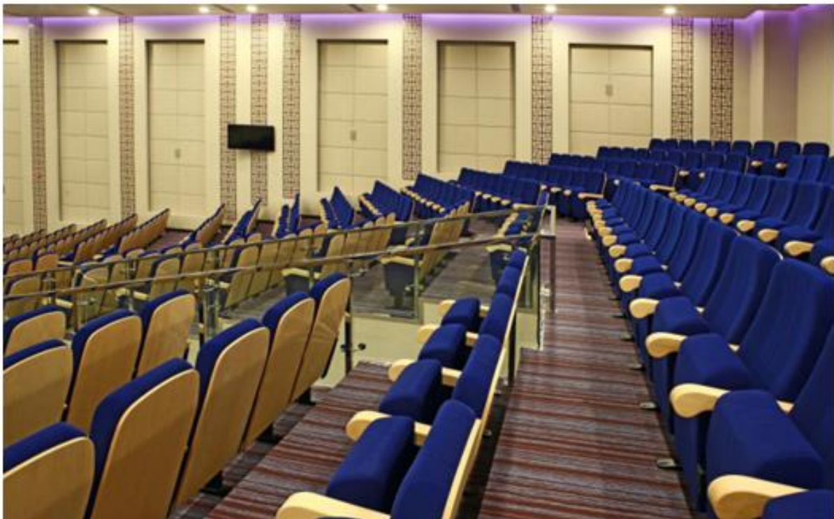
SALÓN DE ACTOS EMIRATES AVIATION UNIVERSITY ABU DHABI | EAU

Para Radio Menor de 10 metros las butacas se implantan con doble brazo (individuales)